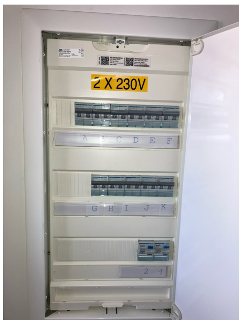
( Elektrisch bord )